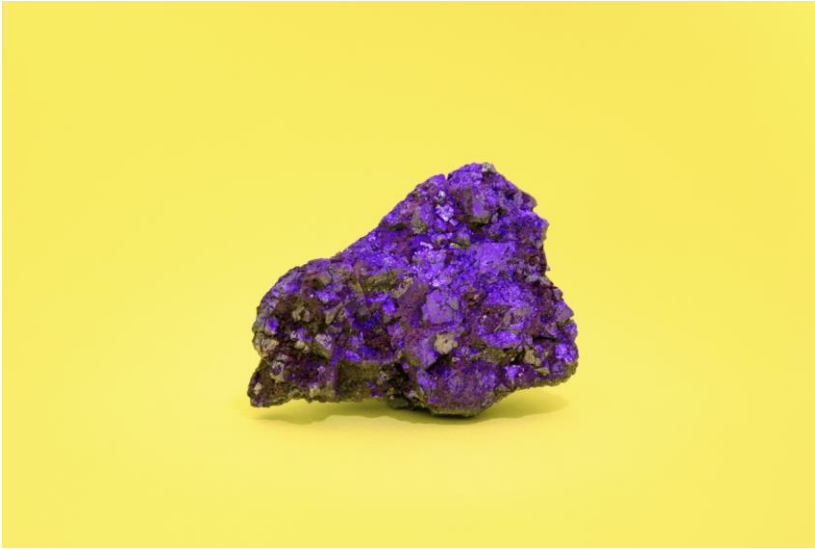
Fluorescent Fool's Gold. SOTRAMI, Santa Filomena, Andes, Peru. 2016