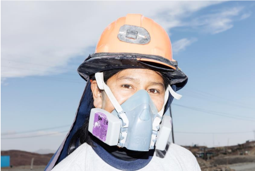
Pallaqueras SOTRAMI, Andes, Peru. 2016.